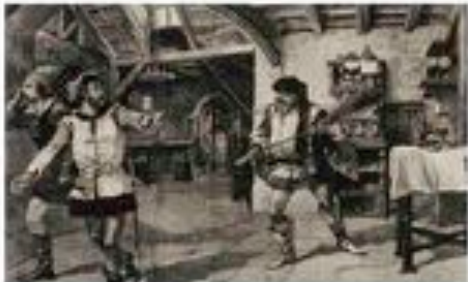
Illegible text block, likely a caption or title for the photograph above.

Illegible text block, likely the first column of an article or report.